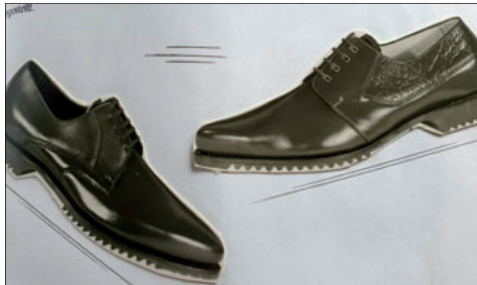
Rahmengenähte Schuhe ohne Zwischensohle aus dem 2. Halbjahr 1965

Um die Produktion steigern und absatzfähigeres Schuhwerk fertigen zu können, wurden klebe-gezwickte und rahmengenähte Schuhe entwickelt.