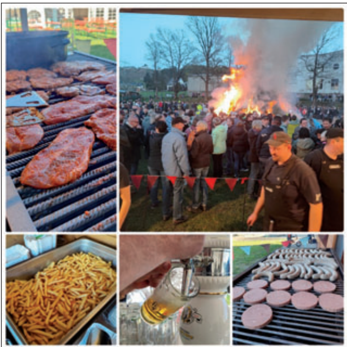
unser Hexenfeuer 2023

Zum Schluss möchte sich auch der Förderverein der FFW noch einmal bei allen Besuchern des diesjährigen Hexenfeuers recht herzlich bedanken. Es war wieder ein rundum gelungenes Fest.