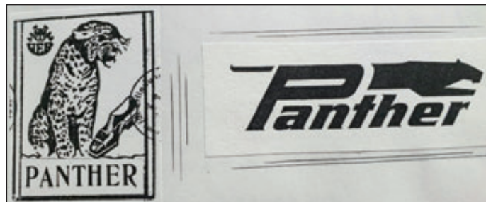
Das Firmenzeichen musste geändert werden. Der sitzende Panther wurde durch einen springenden ersetzt.

1961 kam es zu einem Rechtsstreit mit der Familie Atmanspacher in Bezug auf das bis dahin genutzte Firmenzeichen. Der Firmennamen blieb zwar erhalten, aber der sitzende Panther wurde durch einen springenden ersetzt.