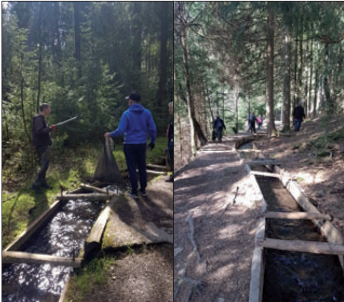
(Bilder und Text: Marianne Gropp, Zinngrube Ehrenfriedersdorf)

Das Team der Zinngrube Ehrenfriedersdorf