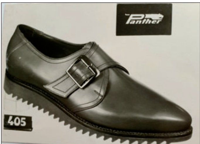
Auch für die Einkleidung der Sportler zu den Olympischen Spielen in Innsbruck 1964 wurde Panther ausgewählt.

Die bisher gefertigten rahmengenähten Schuhe erfüllten nicht mehr die Forderungen des Handels nach flexiblen, bedarfsgerechten, modernen und preiswerten Schuhen.