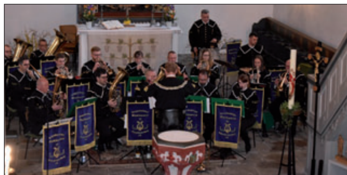
Kirchenkonzert des Bergmännischer Musikverein Ehrenfriedersdorf April 2023