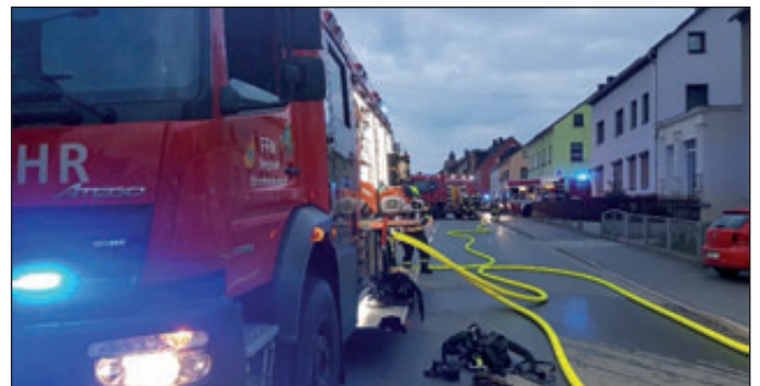
Foto: gemeldeter Zimmerbrand an der B95

Ein weiterer Brand ereignete sich am 28. April in unserem Ort. Hier wurden wir mit dem Stichwort „Wohnungsbrand“ alarmiert. Schon auf der Anfahrt zum Gerätehaus bemerkten einige Kameraden sowohl Brandgeruch als auch eine große Rauchsäule über der Stadt. Nach der Lageerkundung des Einsatzleiters stellte sich heraus, dass ein Holzlager hinter dem Haus brannte. Da sich dies direkt an das Haus anschloss, bestand die Gefahr, dass die Flammen auf das Haus übergreifen konnten. Sofort wurden die ersten Löschmaßnahmen von unseren Kräften eingeleitet. Zeitgleich wurde die Drehleiter in Stellung gebracht um den Bereich des Daches, welches schon mit den Flammen beaufschlagt wurden, zu kühlen und zu kontrollieren.