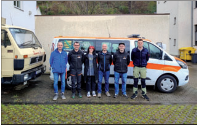
Foto: unsere Teilnehmer des Sanitäter-Lehrgangs

Von den mitalarmierten Kräften aus Geyer und Thum wurde unterdessen die Wasserversorgung sichergestellt. Die Kameraden aus Thum durchsuchten zwischenzeitlich das gesamte Gebäude nach Personen und eventuellen Brandübertritten. Durch das schnelle Eingreifen aller Kräfte konnte ein größerer Schaden und eine Brandausbreitung auf das Gebäude verhindert werden. Zum Hergang des Brandausbruches hat die Polizei Ermittlungen aufgenommen.