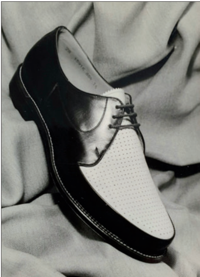
1954 gehörte der Betrieb zu den Ausrüstern der gesamtdeutschen Olympiamannschaft für Melbourne.