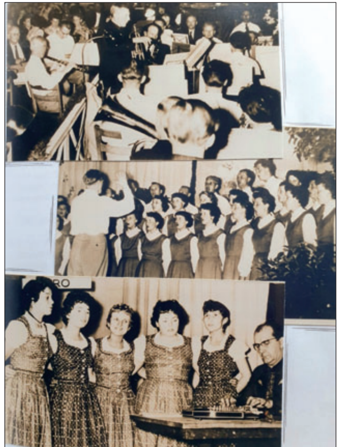
Eine breit gefächerte Kulturgruppe mit ca. 130 Personen (Chor, Instrumentalgruppe, Heimatsingegruppe und Laienspielgruppe) erfreute mit ihren Programmen und Darbietungen Betriebsangehörige und Bevölkerung.

Die BSG Fortschritt entwickelte sich aufgrund der vielfältigen Unterstützung durch den Betrieb Panther und engagierten Betriebsangehörigen zu einer leistungsfähigen Mehrsparten-Gemeinschaft.