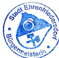
Silke Franzl Bürgermeisterin