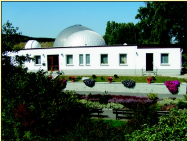
Zeiss-Planetarium und Volkssternwarte Drebach

Streckenlänge: einschließlich Planetenwanderweg / Erdgeschichtslehrpfad ca. 13,5 km.